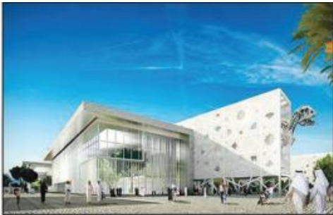
شكل رقم (١١٦). صورة توضح مركز عبدالله السالم الثقافي