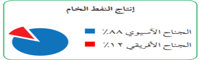
شكل (٦٨) يوضح نسب إنتاج واحتياطي النفط والغاز الطبيعي في الجنح الآسيوي والجنح الأفريقي في الوطن العربي