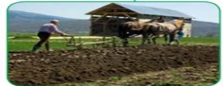
شكل (٥٨) المشكلات التي تعاني منها الزراعة في الوطن العربي