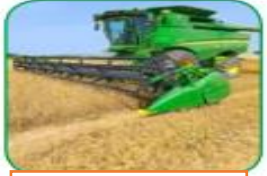
الالات و المعدات